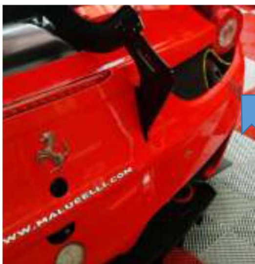
Fig. 3 - GT3-029 Attacco aria impianto di sollevamento / Lifting system air jack

The pneumatic lifting system air jack may be moved in lateral position, as shown in figure 3.