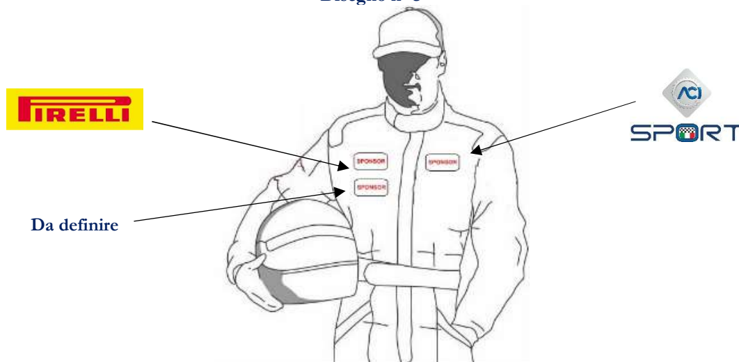
Disegno n° 3