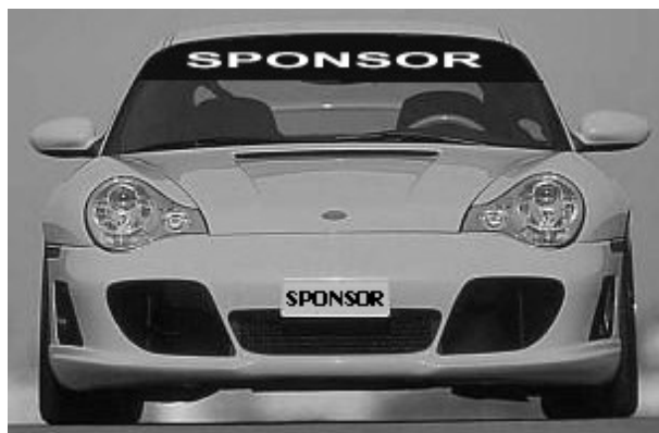
Disegno n° 2: Fascia Parasole e targa anteriore: modalità di applicazione