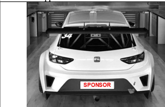
Disegno n° 3: Targa posteriore: modalità di applicazione