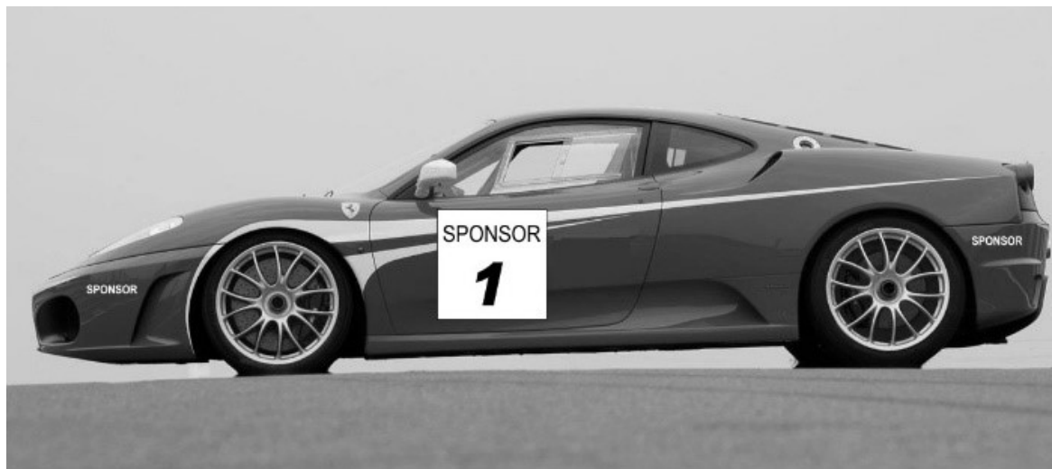
Disegno n° 1: Placca Portanumero e adesivi su paraurti: modalità di applicazione