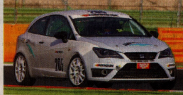
Al secondo weekend stagionale sulla nuova Seat Ibiza TSI, Davide Pigozzi, qui in uno spettacolare controllo, ha vinto gara 2 per il TCS.