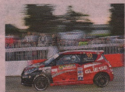
Corrado Peloso comanda tra le Swift RTB

SUZUKI RALLY CUP Peloso fa doppietta e va in testa alla classifica con 14 punti su Rivia