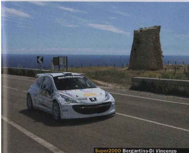
Super2000 Bergantino-Di Vincenzo