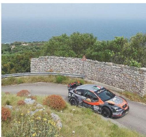
RALLY DEL SALENTO Chentre-Gualtieri

Pedersoli, Cavallini e Porro: sarà battaglia