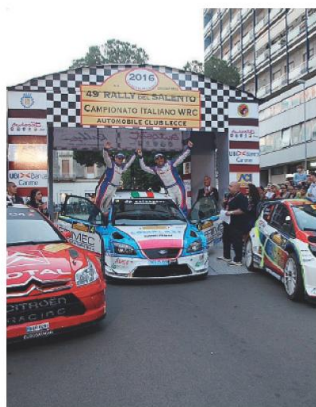
L'ARRIVO Il podio in piazza Mazzini

RALLY DEL SALENTO UN PERCORSO PIENO DI INSIDIE CHE HA COSTRETTO MOLTI A NON PORTARE A TERMINE LA GARA