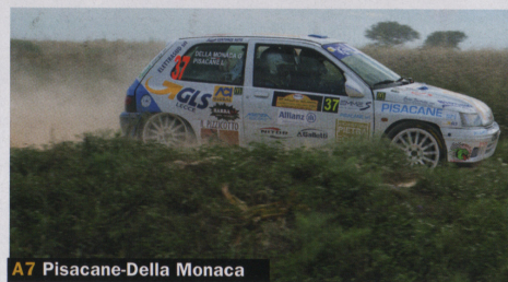
A7 Pisacane-Della Monaca