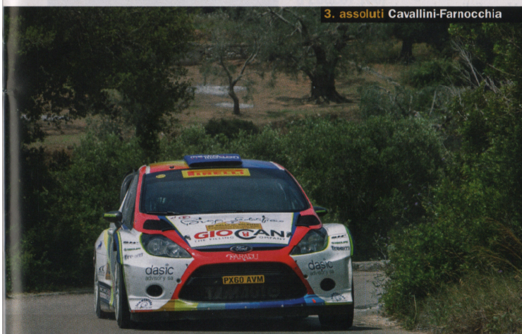
3. assoluti Cavallini-Farnocchia