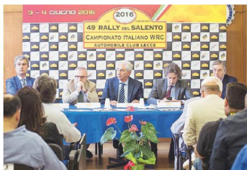
RALLY La presentazione della corsa che si svolgerà venerdì e sabato