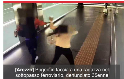
[Arezzo] Pugnò in faccia a una ragazza nel sottopasso ferroviario, denunciato 35enne

Per la tua Pubblicità su: #gonews.it 0571 700931 commerciale@xmediagroup.it