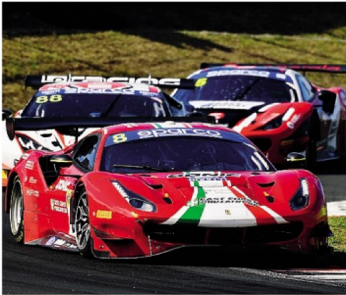
Roda secondo nella GT