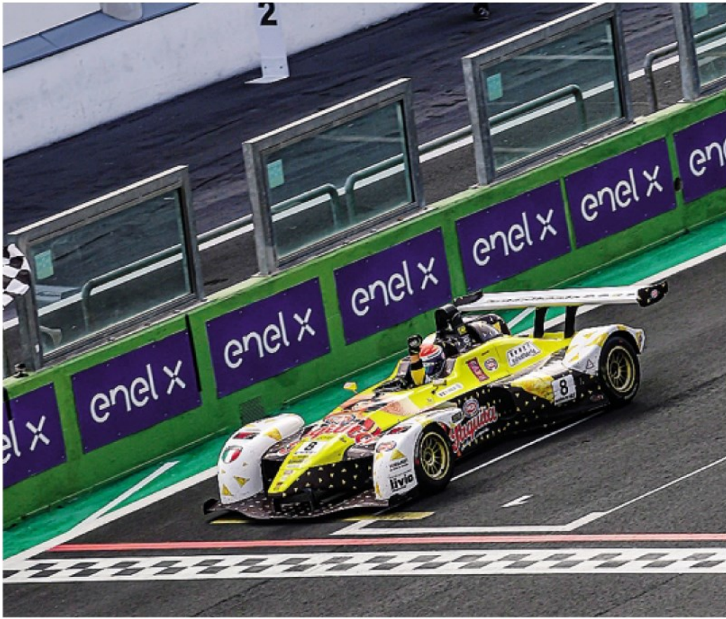
Uboldi taglia il traguardo dopo la fantastica rimonta