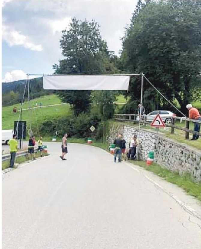
I volontari al lavoro per allestire il percorso di gara

ARTICOLO NON CEDIBILE AD ALTRI AD USO ESCLUSIVO DEL CLIENTE CHE LO RICEVE - 2019