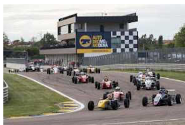
FORMULA CLASS JUNIOR