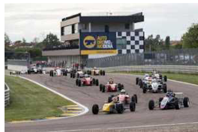
FORMULA CLASS JUNIOR