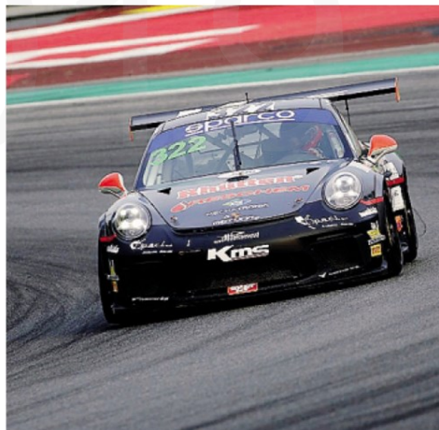
La Porsche GT3 di Mainetti

ARTICOLO NON CEDIBILE AD ALTRI AD USO ESCLUSIVO DEL CLIENTE CHE LO RICEVE - 2019