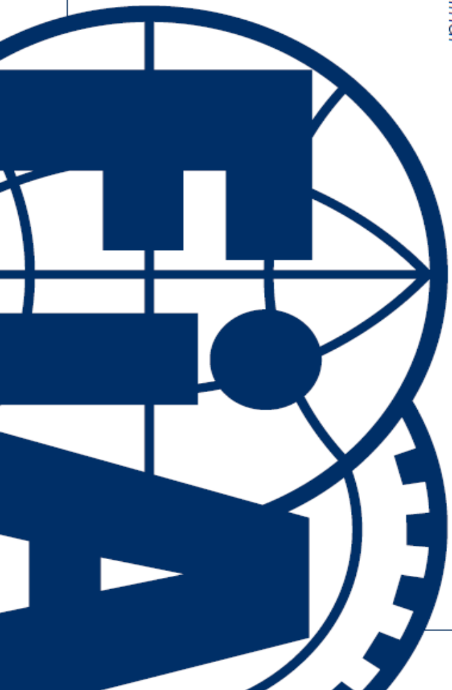
Jean Todt FIA President

Who has participated in the FIA Race Director Seminar from 6 to 7 February in Geneva, and successfully completed the assessment.