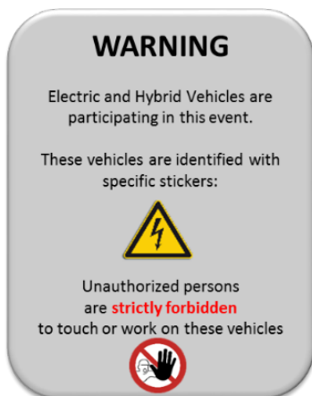
Exemple de ticket

Il est recommandé d'afficher un document d'une page dans des endroits visibles (entrée/sortie des stands, guichets d'accueil, à proximité des zones publiques, etc.).