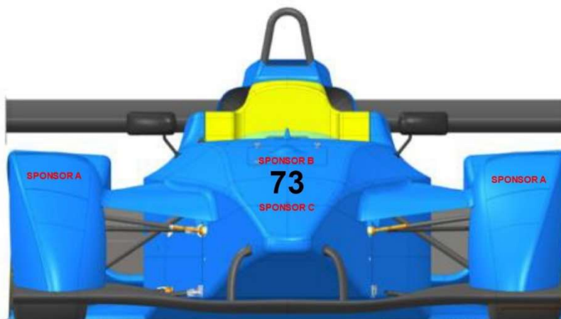
Schema di posizionamento Frontale: